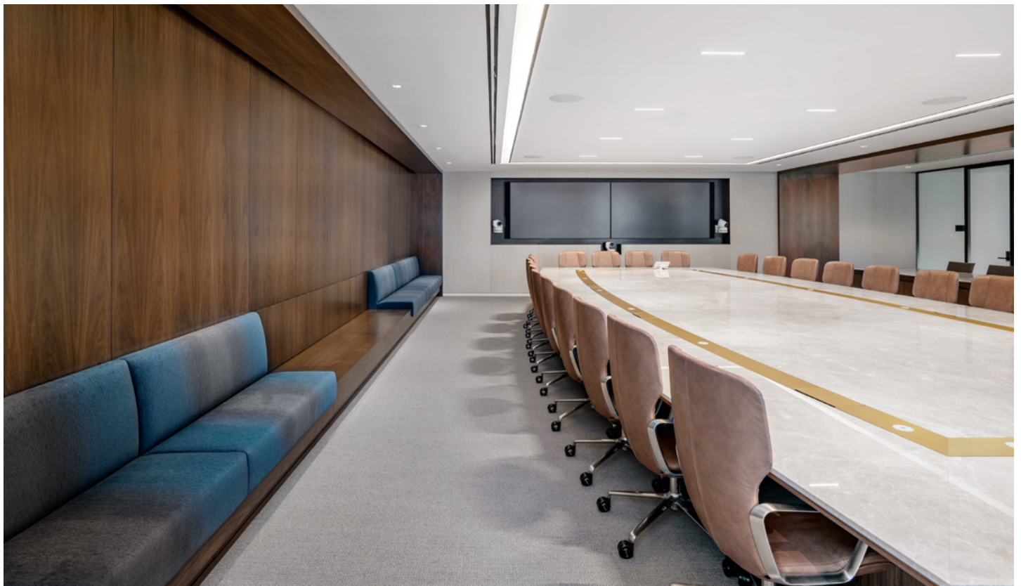
Les trois hauteurs de dossier et le piétement au choix sur roulettes ou patins multiplient les possibilités d'utilisation – depuis le poste de travail jusqu'à la salle du conseil.