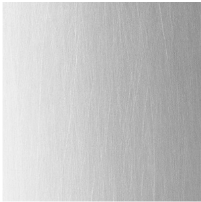
52 Aluminium poliert