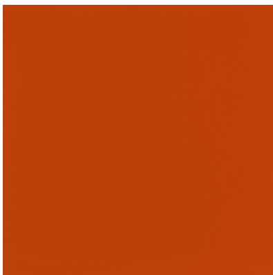
83 Orange matt beschichtet (RAL 2001)